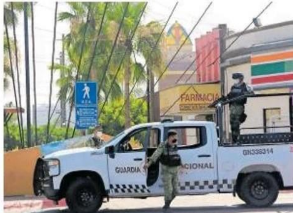
Hernández Niebla mencionó que si estuvieran trabajando los más de dos mil elementos federales de la Guardia Nacional habría una mayor presencia policíaca.

DE ACUERDO CON el reporte de la Fiscalía General del Estado, Tijuana registra 300 homicidios dolosos en 2021; en 25 días de febrero van 125