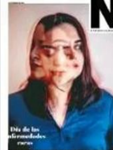
Una de las periodistas. eranes

En los campos del Valle Imperial laboran 18 mil mexicanos y el 80% de ellos radica en esta capital, por lo que a diario deben cruzar la frontera.